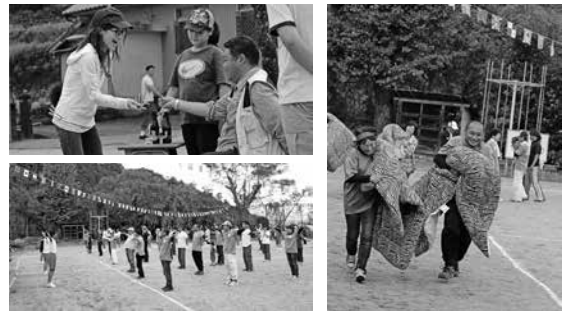
横島地区民大運動会の様子