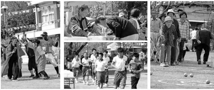
野老山地区ぐるみ運動会の様子

当日は天候にも恵まれ、地域の方々をはじめ、越知中学校の生徒の皆さん、高知フアイトイングドッグスの皆さんにも参加してもらい、子どもからお年寄りまで大勢の参加で盛り上がりました。