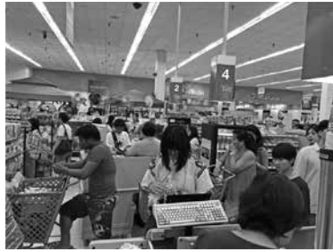
地元スーパーで買い物体験