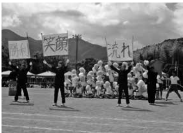
青組対赤組の応援合戦