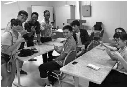
Gum大学の学生さんたちと語学研修