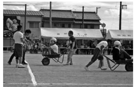
親子競技で保護者も頑張る！