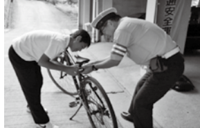
自転車キャンペーン