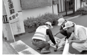
ストップマーク設置