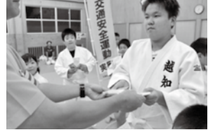
反射材配布 (少年柔道)