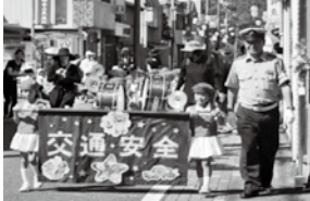
交通安全パレード

9月21～30日の期間、交通安全パレード、ドライバーサービス、各種キャンペーンなどが行われました。運動に参加して頂いたボランティアの方や指導員の皆さま、ご協力ありがとうございました。