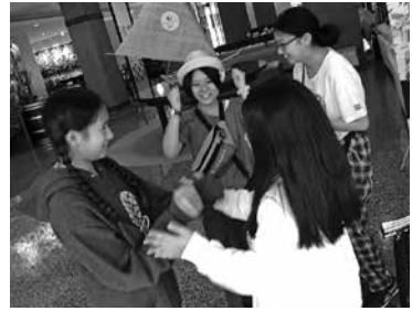
ホストファミリーとの対面