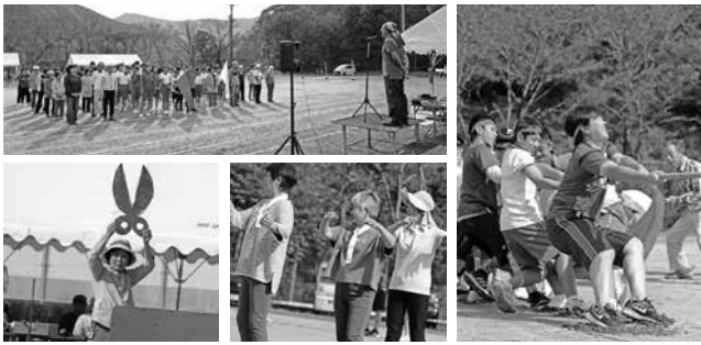
明治地区ぐるみ運動会の様子