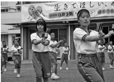
役場前鳴子踊りお披露目(9月13日)

気持ち良い晴天の中、元気いっぱい体育祭が行われました。お互いがんばりをたたえ合う閉会式が感動的でした。ご参加いただいた保護者の皆さま、ご声援いただいた地域の皆さま、ご来賓の皆さま、ありがとうございました！