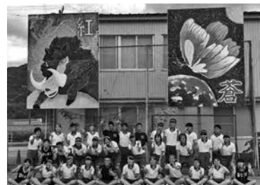
色看板はイノシシと蝶