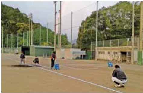
グラウンド整備をする越知バッファロー

今大会は、台風などで天候に恵まれず、例年よりも試合の進行がかなり遅れましたが12月中旬に終了することができました。