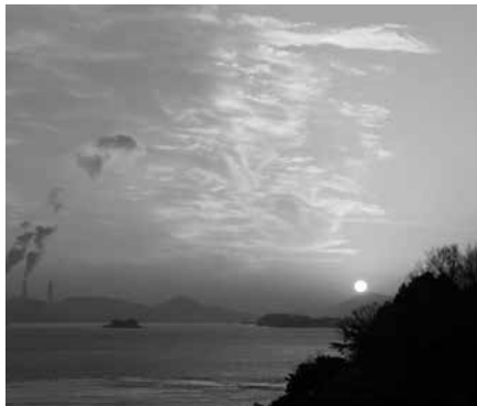
実家の2017年の初日の出