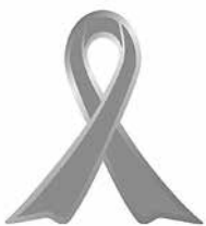
子ども虐待防止 オレンジボン運動

・高知県心の教育センター ◎24時間子ども SOS ダイヤル（無料） TEL 0120 (0) 78310 ・児童家庭支援センター ひだまり（佐川町） TEL (20) 0203 ・中央児童相談所 TEL 088 (866) 6791 ・子どもの人権110番 TEL 0120 (007) 110