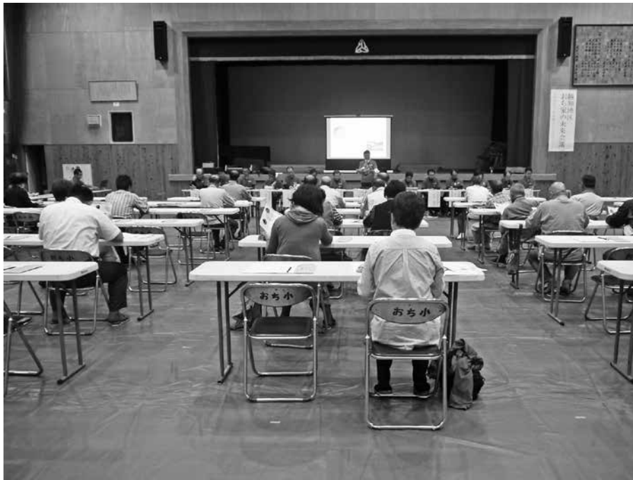
中学校で開かれた第1回目の越知地区未来会議の様子

問 町民会館は緊急時の避難場所など多目的に使われているが、雨漏りがひどくなっている場所がある。重点的に補修・改善をしないと大きな問題が出るのではないかと。教育長 現在補修工事を計画しているところ。