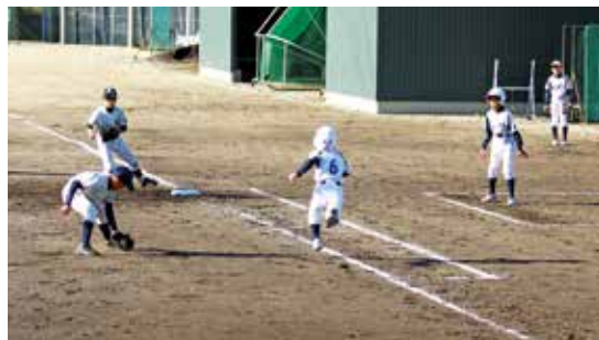
越知バッファロー試合の様子

越知バッファローは、初戦のうきつ・田野連合を8対1、二回戦は楠目スポーツ少年団を4対2、三回戦は諸木スワローズを6対0、準々決勝は葉山メッツを7対2と勝ち進みました。 準決勝では桜ヶ丘スポーツ少年団と対戦し、健闘惜しくも0対3で敗れましたが3位入賞を果たしました。