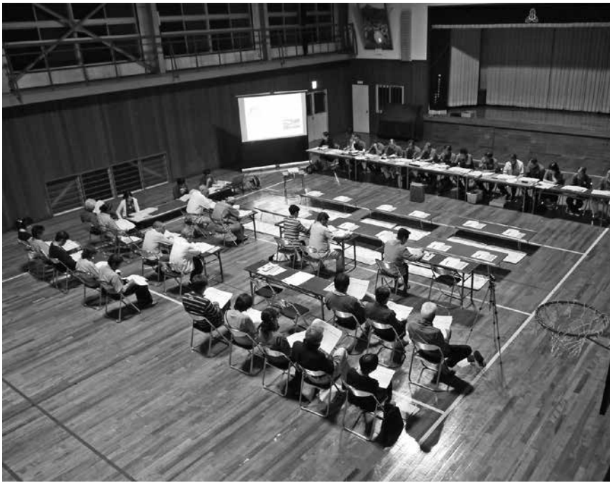
横島地区おち家の未来会議の様子