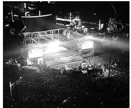
ソウルの除夜の鐘行事は大人気

年末年始は、一年中で私の一番好きな時期です。しかも、日本は年末年始の休みが長いので大変ありがたいです。実は、韓国は年末年始の休みがたった1日だけなんです。なぜなら、韓国では、1月1日が正月ではなく、旧暦の1月1日がお正月だからです。つまり、お正月が毎年変わることですが、大体1月の終わりから2月の中旬ごろになります（今年は2月16日）。なので、1月1日は、年が変わったという意味しか持たないです。しかし、年賀状を書く風習や、除夜の鐘、初日の出など新年のイベントは日本と同じように味わいます。