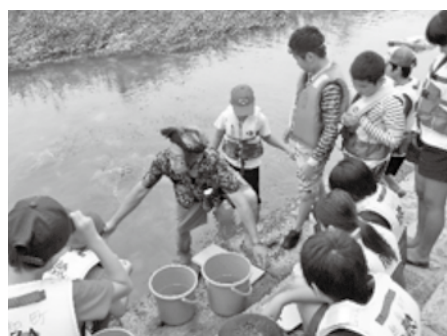
越知町キャンプイベント