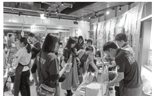
11月のイベントの様子

す。このように寄附者さまの声を生産者さまにも直接聞いてもらえる機会があればいいなど感じました。うれしい事に寄附者さまが返礼品を気に入ってくださり、これを「ネットで買えたらいいのに」というお声をたまに頂戴します。私も東京に住んでいた時に同じ思いをしたことがあったので、気持ちがあつてよかった。せっかく良い特産品があるのにふるさと納税だけではもったいない。ぜひ、ふるさと納税の枠を超えて寄附者さまと生産者さまがつながってほしい。任期中にそんな環境づくりをしていきたいです。