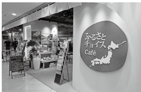
11月のイベント会場

イベントで寄附者さまの声を直接聞ける機会があることは、パソコンと向き合ってから新しい情報や、生産者さまの気持ちを発信しているだけではわからないことを知ることができてとても勉強になりました。