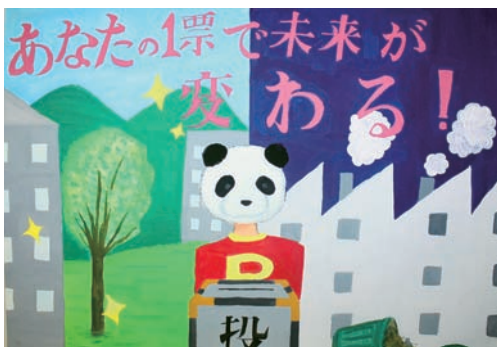
明るい選挙啓発ポスター受賞作品