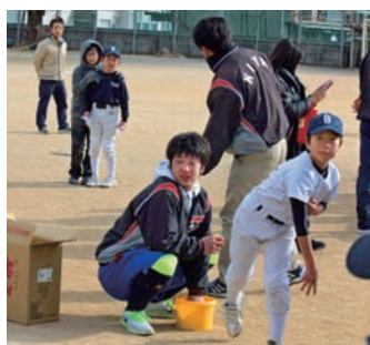
高知FDの的当てゲーム!