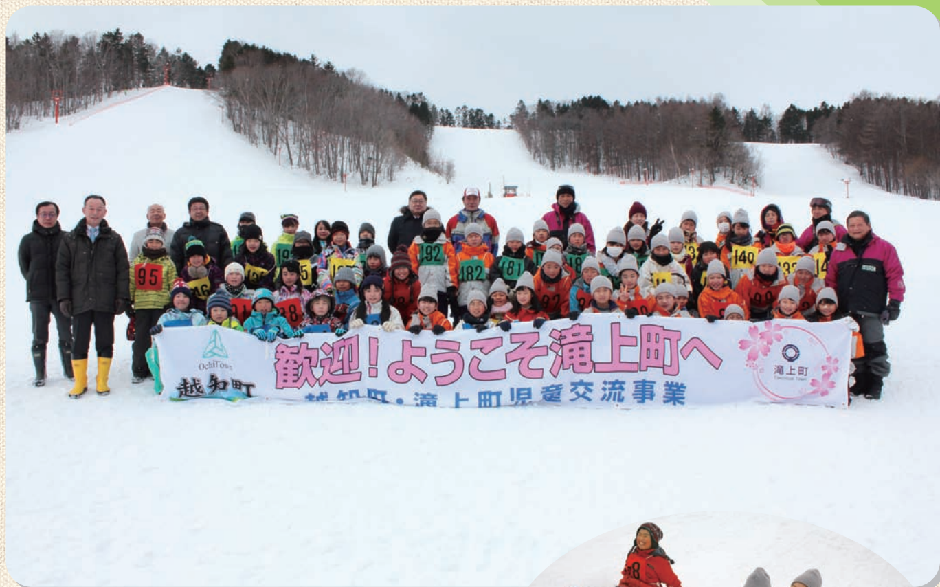
—越知町・浦上町児童交流事業 2月7日～9日—