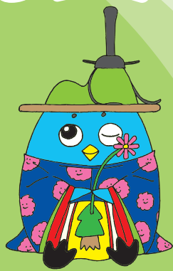
越知町イメージキャラクター