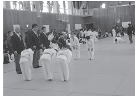
礼に始まり礼に終わる