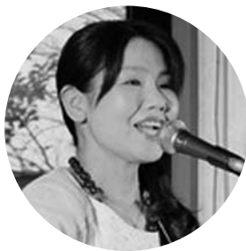
土佐市のシンガー ソングライター