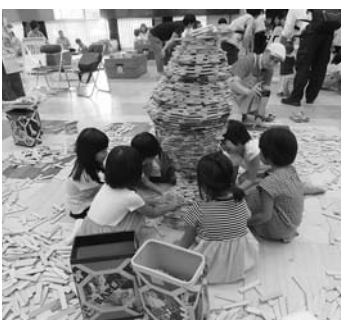
木のおもちゃで遊ぶ子どもたち