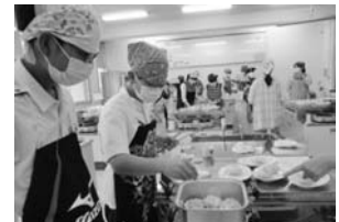
おいしくできるかな～？