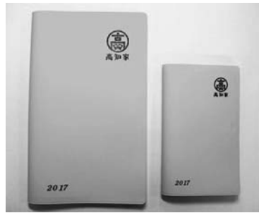
今年の手帳の色は黄色です