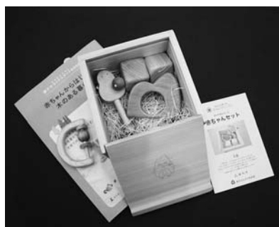
プレゼントされた誕生祝い品