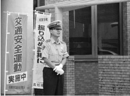
交通安全パレード出発式