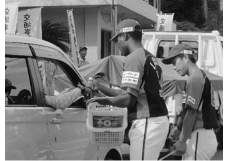
ドライバーサービス(越知町国道33号)