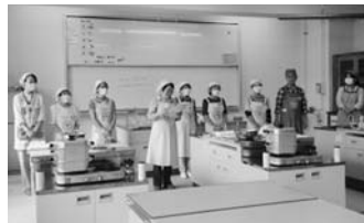
ヘルスマイトさん