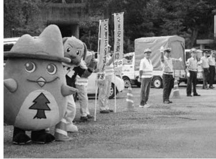
ドライバーサービス(越知町国道33号)