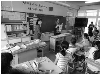
6年外国語活動 スペシャルデーを受け答える コミュニケーション