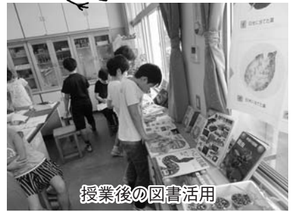
授業後の図書活用