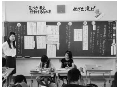
5年国語 先生に頼らず自分たちで進める授業 コミュニケーション