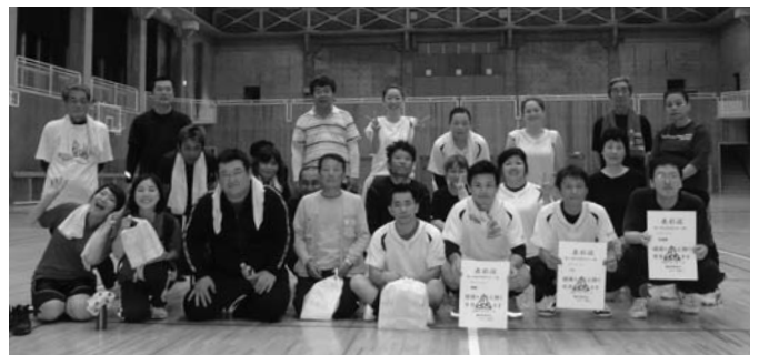
スカッシュバレー