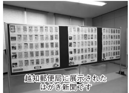
越知郵便局に展示された はがき新聞です