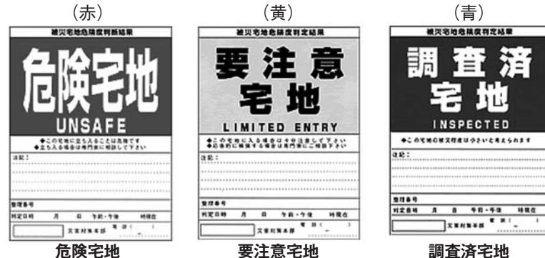
危険宅地 この宅地に入るのは危険です。 要注意宅地 この宅地に入るときは十分に注意してください。 調査済宅地 この宅地の被災程度は小さいと考えられます。

被災宅地危険度判定とは、大規模な地震や大雨などに伴い、宅地が大規模で広範囲に被害を受けた場合に、宅地の被害状況を迅速かつ的確に把握した上で危険度を判定し、住民の皆さんに情報提供を行うことで、二次被害の軽減・防止を図ろうとするものです。