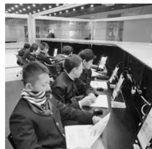
東証アローズで株式の売買を シミュレーション