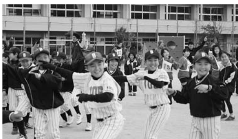
越知中野球部による楽しいアップ 笑顔がこぼれます