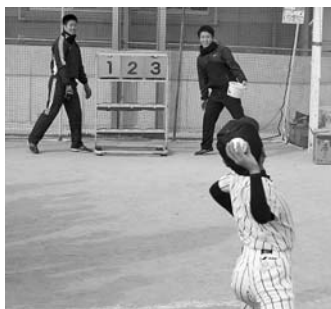
高知FD的的当てゲーム！