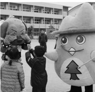
ドッキーとよコジロー