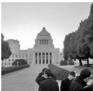
国会議事堂にて (国会の中も見学できました)

5 修学旅行 東京へ行ってきました! 1月25日から28日の3泊4日の旅程で2年生は東京へ修学旅行に行ってきました。主な研修先は、国会議事堂、早稲田大学、東証アローズ、東京ディズニーランド、お台場のフジテレビ、東京スカイツリーなど、首都東京ならではの研修とキャリア教育の推進に役立つ内容でした。