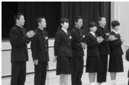
新執行部のメンバー

2 新執行部始動! 学校生活、行事、学習の取り組み、地域との交流など、越知中学校の生徒会活動は学校の力の源です。生徒会をリードする新執行部が1月8日に認証式を行いました。いよいよ本格的な活動が始まります。