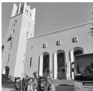
早稲田大学大隈講堂