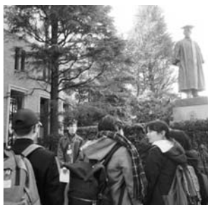
大隈重信の銅像前で