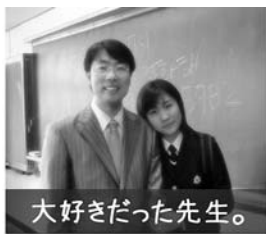
大好きだった先生。

そのプレゼントとは、バラ・香水・キス！という3つです。それぞれ理由があるのですが、バラは花言葉どおり情熱と愛を持つ成人になりますように、香水は良い香りのように人に良い記憶として残る人になりますように、最後のキスは成人になったからには、責任のある愛をするようにという意味だそうです。結局恋人がいない20歳に成年の日なんて何の意味もないと言っても過言ではありません。ということで、私は成年の日を全く覚えていません（笑）