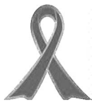
子ども虐待防止 オレンジリボン運動