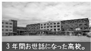
3年間お世話になった高校。

韓国は年の数え方が日本と違い、満年齢ではなく、数え年なので高校卒業した年が20歳です。卒業してからは普通にお酒が飲めるようになるので、若いときは卒業と同時にこれからは大人！と考えたでしょうね。なので、どちらかというとも高校の卒業式が日本の成人式に近いと思います。