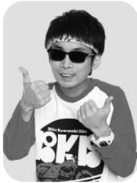
バイク川崎バイク