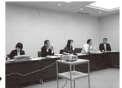
熱く語る南部町の 教育長さん！ (ワイシャツの方です) →

☆4月から立ち上げる、越知小・中学校のコミュニティ・スクールにとって意義のある研修になりました。