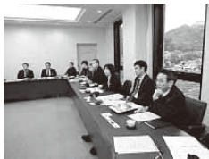
真剣に聞く 越知町の 皆さん！

○南部町より…南部町の教育長さんは、文部科学省認定のコミュニティ・スクールマイスターということで、コミュニティ・スクールについて、深い見識を持ち、次のように意義を指導してくださいました。「学校は、地域の様子を知り、地域の願いを受け止める、地域は学校の取り組みや、学校の目指す方向性をきちんと理解すること」そして「学校が自立し、学校と地域がともに教育に取り組むためにコミュニティ・スクールがあります」と。