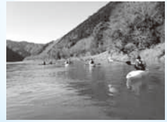
地域おこし協力隊

計16人で四十市のカヌー館というところへ行ってきました。外にいれば、「ひやい！」と言いたくなる寒さの中、カヌー館では冬のシーズンもカヌーのツアーをしているということで、みんなを体験してきたんです。 移動中のバスの中での一枚です。みんなの気分も盛り上がり上がっています。