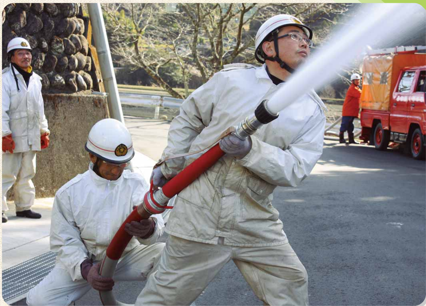
—消防団出初式（初午） 2月4日—