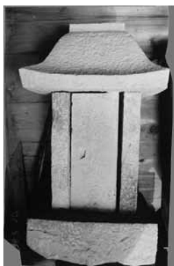
黒瀬阿弥陀堂内の祠堂

石造の祠は数多いが、銘の入った物は越知町内でもここだけで、しかも江戸時代中期の宝永四年と銘の刻まれた貴重なものです。当初からこの堂内にあつたということは考えられませんが、風化もほとんど進んでおらず、多少のひび割れが目につくのみで、条件の良い環境下にあつたことは明らかです。