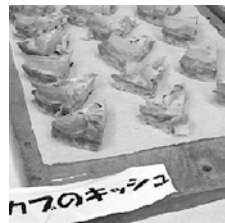
田村カブは大平カブよりもピリッとした感じ

カブだけでなく、胡瓜や大根など、世代を超えてつないできた種を守る方たちが越知にもたくさんおられますが、すべての伝統と同じく、若い世代が種を継いでいかなければ途絶えてしまう運命です。ぜひ、越知で育まれたほかにない財産をつないでいきたいですね。