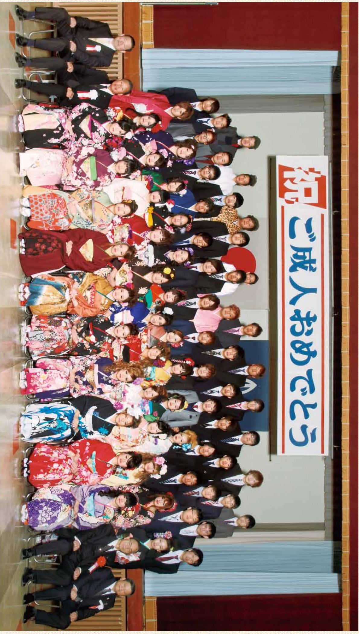
越知町新成人の集い 平成26年1月3日