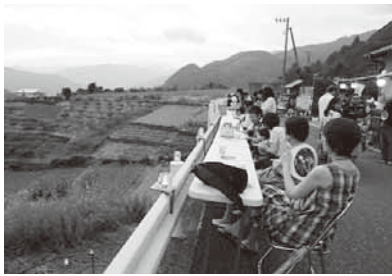
道路で飲食しながら キャンドルを楽しむお客さん

以下、2日間ボランティアで手伝っていただいた県内の大学生と地元の方の感想をご紹介します。