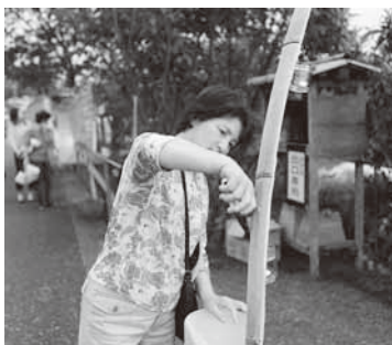
キャンドルに火を点ける来場者