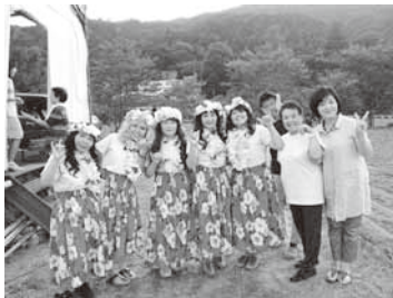
この日のメンバーと舞台袖にて。

★7月には、谷ノ内フラガールズとして出場した明治地区予選で大衆賞に輝き、にょどかあにばるでの本選に出場しました。(観ていただけましたか!)惜しくも入賞は逃しましたが、谷ノ内のお母さん方との舞台、とっても楽しかったです。