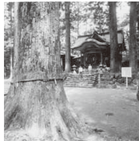
横倉山中腹鎮座 祭神 伊邪那岐神