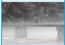
地域おこし協力隊

今年のお盆は、家族が東京から越知に来てくれました。まさか家族十人で過ごせるとは思わなかったなあ。(笑)せつかく来てくれたんで、夕食は自分なりに少し仕込んでみました。