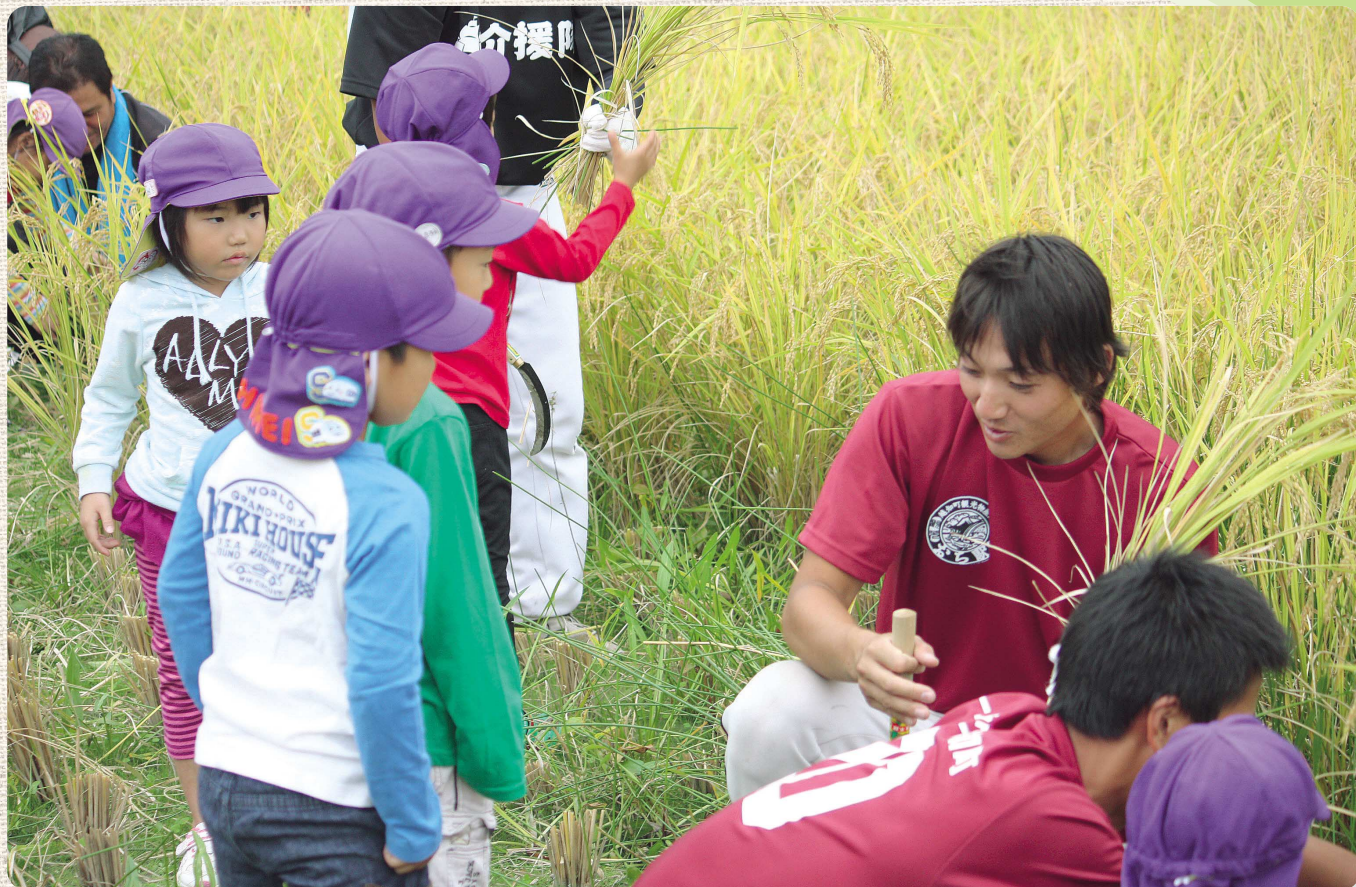
—高知ファイティングドッグスの選手たちと稲刈体験 10月10日—