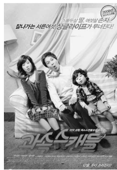
「過速スキャンダル」