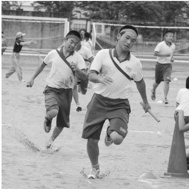
(画像は、最後の色別責任リレーの様子です。水しぶきからトラックの状態がお分かりかと思ます。)

9月16日(日)に実施しました。台風の影響もあり、朝からグズついたお天気で、今成の運動場には水溜りが沢山ありました。開催するかどうか、悩みましたが、雨中での体育祭、生徒にとって大変思い出の多い、行事となりました。