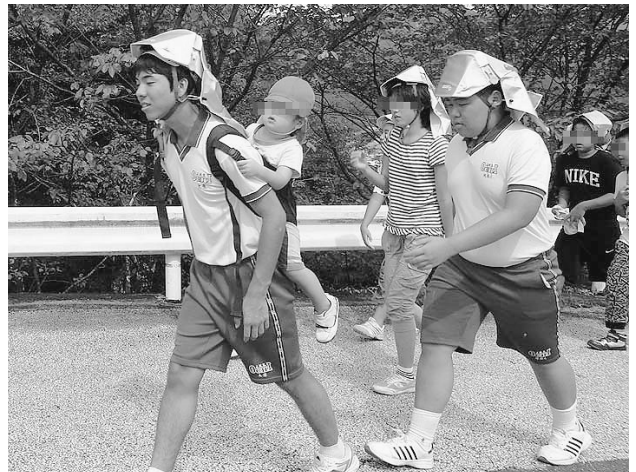
(9月3日(月)に実施された、避難訓練の様子。本校ブログより。中学生以外の方は、顔にモザイクを入れております)

中学生は、越知保育園の園児と一緒に町民会館まで避難しました。小さな園児は、ご覧のとおり、交代で背負って移動しました。