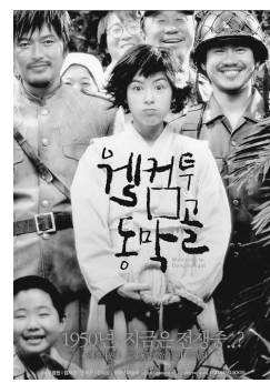
「トンマッコルへようこそ」