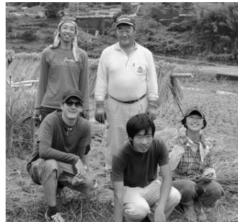
強力な助っ人たち！

が、自分で食べるのも、いろんな人に食べてもらうのも、とっても楽しみます。来年は、もっと上手に作れるように、頑張ります。