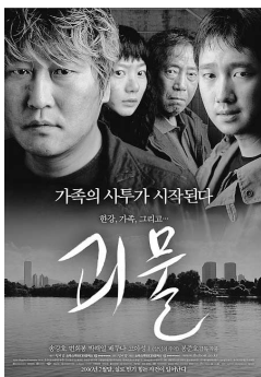
ハンガン 「グエムル-漢江の怪物」

以上で紹介した4つの作品はあらゆる年齢層が鑑賞できますので、ぜひ家族皆さんでご覧ください！それでは、また来月に。