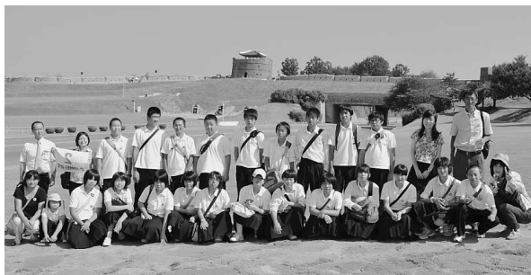
▲世界文化遺産である水原華城を背景として2年A組の皆さん