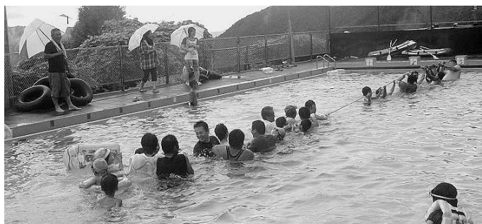
▲ 8 / 5 雨のプール大会。水中綱引きの様子。