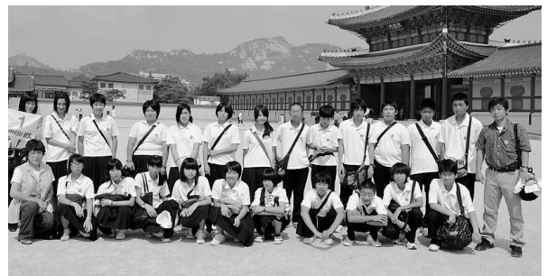
▲朝鮮時代の王宮である景福宮の前で2年B組の皆さん