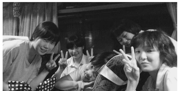
▲帰りのバスの中で元気モリモリだったB組さん。お世話になりました！