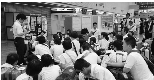
▲いよいよ韓国行くで！松山空港でワクワクしながら出国手続きを待っています～

特に2年B組の一員になってお世話になりました。本当にありがとう。もちろん2学期にも週一回の国際サロンで会えるからこれからもよろしくね。皆さん、お疲れさま！