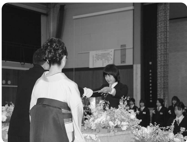
3月14日 越知中学校卒業式