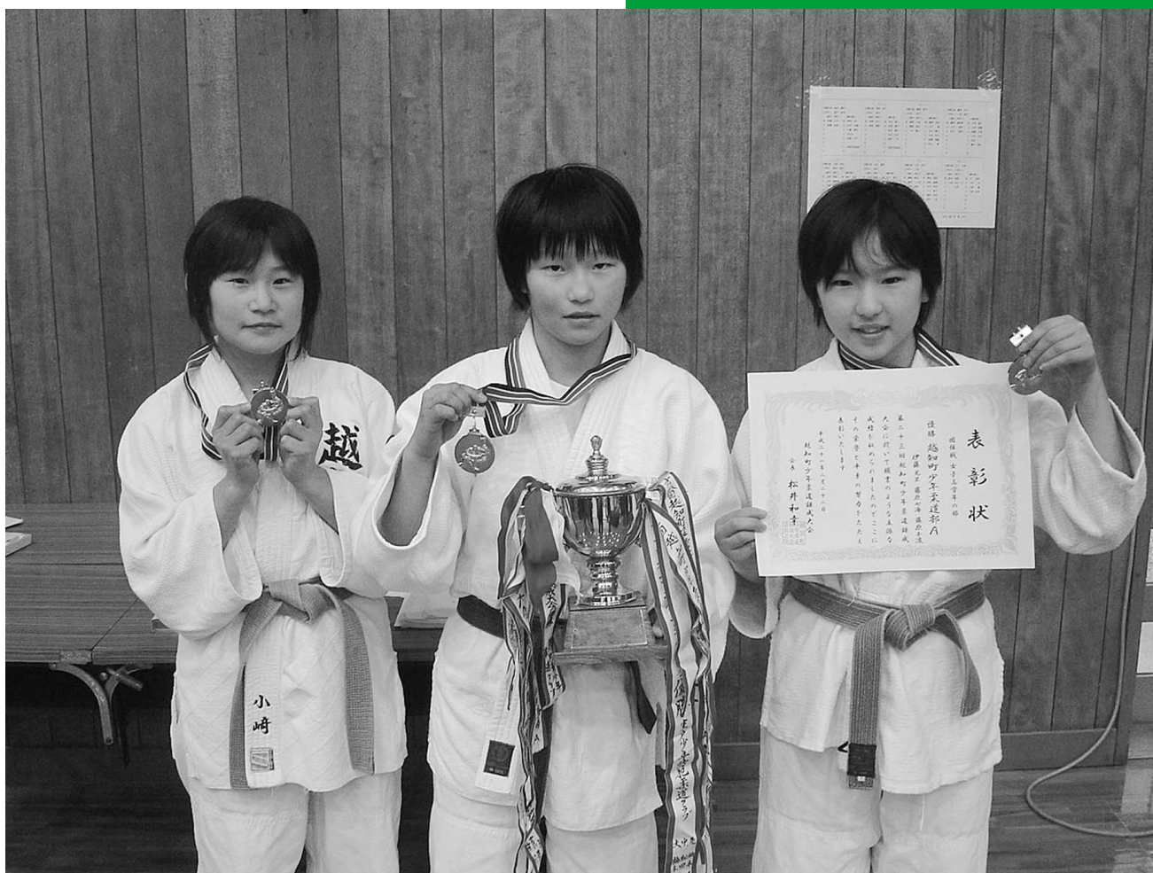
第23回 越知町少年柔道錬成大会団体戦女子 高学年の部で見事優勝した越知町少年柔道部