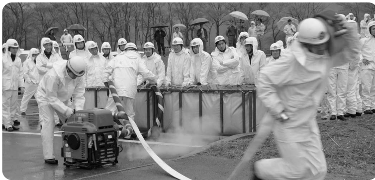
火点早掛け防水訓練

この演習は2年に一度、両町の消防団員の技術の向上と親睦を深めることを目的として行っているもので、午前中