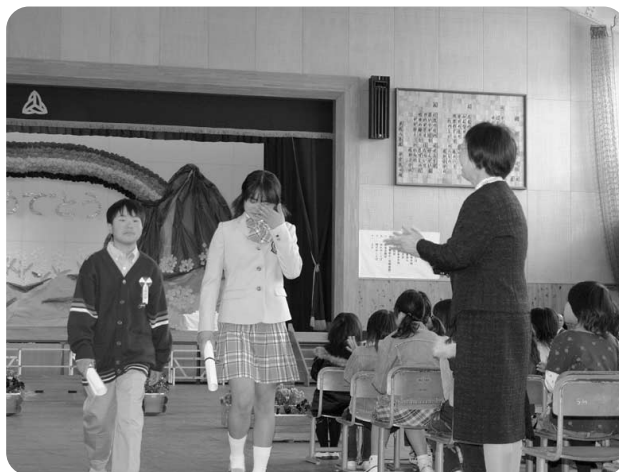
3月21日 越知小学校卒業式