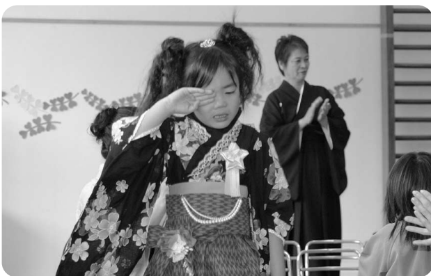
3月24日 越知幼稚園卒園式