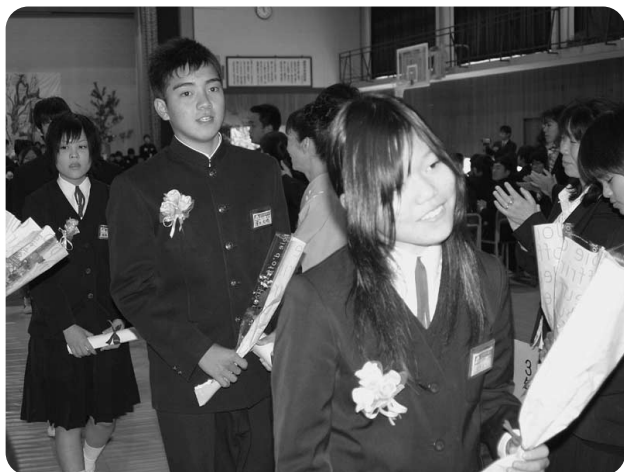
3月14日 越知中学校卒業式