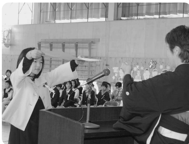
3月21日 越知小学校卒業式