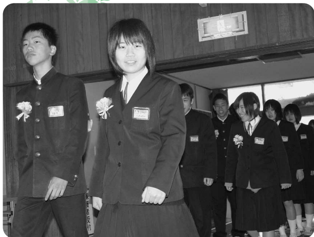
3月14日 越知中学校卒業式