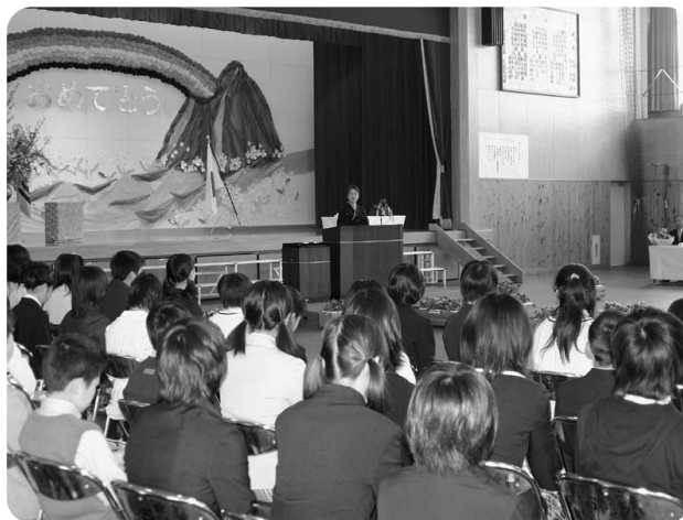
3月21日 越知小学校卒業式