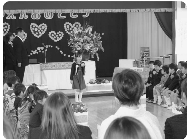
3月25日 越知保育園卒園式