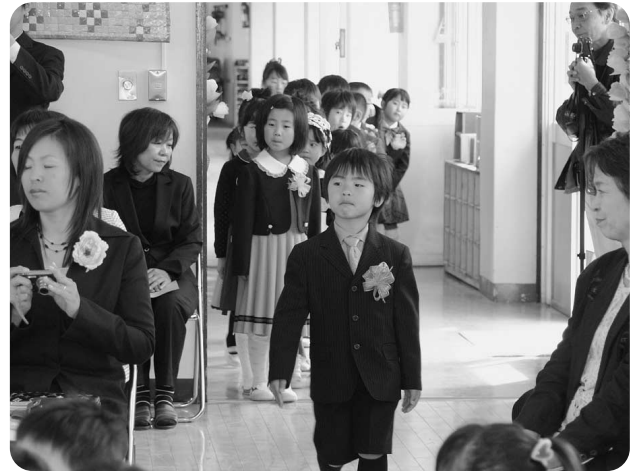
3月25日 越知保育園卒園式