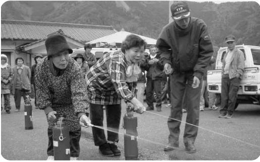
消火器による消火訓練 (日ノ浦・清助)

2月22日に鎌井田老人里の家で、3月8日に日ノ浦集会所で、それぞれ防災訓練・防災学習会が行われました。両地区とも、多くの住民が参加してくれており、高吾北消防署、消防団などの協力・指導を受けて、土砂災害や地震についての学習に始まり、消火訓練やAEDを使用した心肺蘇生法の講習などを熱心に実施しました。