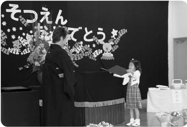
3月24日 越知幼稚園卒園式