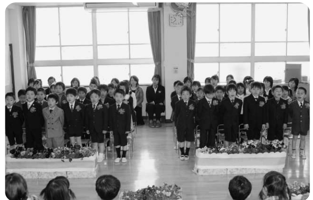
3月25日 越知保育園卒園式

平成20年度卒業生・ 卒園生数 越知中学校 71人 越知小学校 48人 越知幼稚園 20人 越知保育園 35人