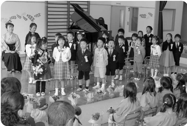
3月24日 越知幼稚園卒園式