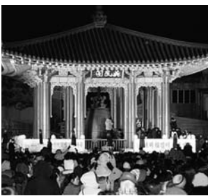
宗路のボシシガク

宗路にある普信閣(ボシシガク)で、除夜の鐘突きが行われるため、新年を迎えるこの打鐘式にはいつもたくさんの人々が訪れます。直接行っていない人たちもテレビで打鐘式を見ながら、新年のカウントダウンをして、お祝いの言葉を交わします。「セヘ、ボク、マニ、バドゥセヨ〜!(新年福がいっぱいありますように)」。