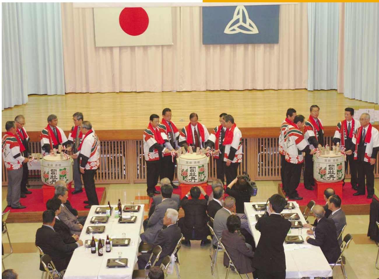
10月25日 新越知町制50周年記念式典