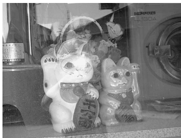
「キラキラひかるまねきねこ」

登録された越知町の世間遺産は、世間遺産ホームページ http://www.seken-isan.net/ でご覧いただけます。