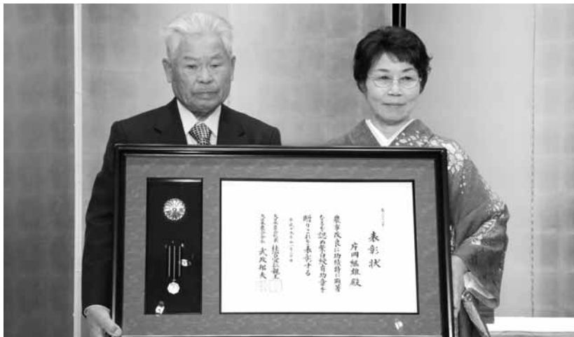
おめでとうございます

は、緑・水・人で成りたつていると思つています。地域のためになる農業を目指しこれからも頑張りますので皆さんと一緒に協力をお願いします」と地域への想いを伝えてくれました。