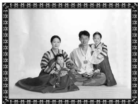
ソルビムに着替えた家族

られてしまうのです。子どものころは、寝てる間に年を取って、お祖母ちゃんになるぞ”と言われて、寝るのを怖がっていた覚えがあります。こらえきれず寝てしまうと、ソルナルの朝白く塗られた眉毛を見て泣いた記憶もあります。はいよいよソルナル当日になりました。大晦日の遊び疲れもソルナルの朝寝坊は通じません。朝早くからシャキッと起き、顔を洗い、新しい韓服（ハンボク）に着替えます。ソルナルの朝、初めて着る新しいハンボクを（ソルビム）と言います。