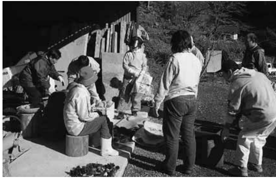
木の実などの飾り炭

す。「よし、そろそろ…」と焚き付け口をふさぎ、窯の中の木を“蒸し焼き”にします。蒸し焼きにすることで、炭が出来上がるのですが、このタイミングをつかむには、熟練の技が必要です。