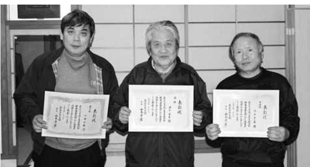
おめでとうございます