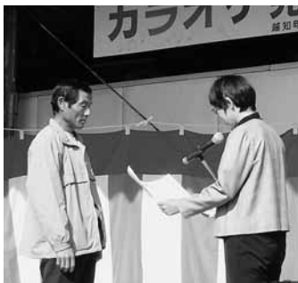
おめでとうございます