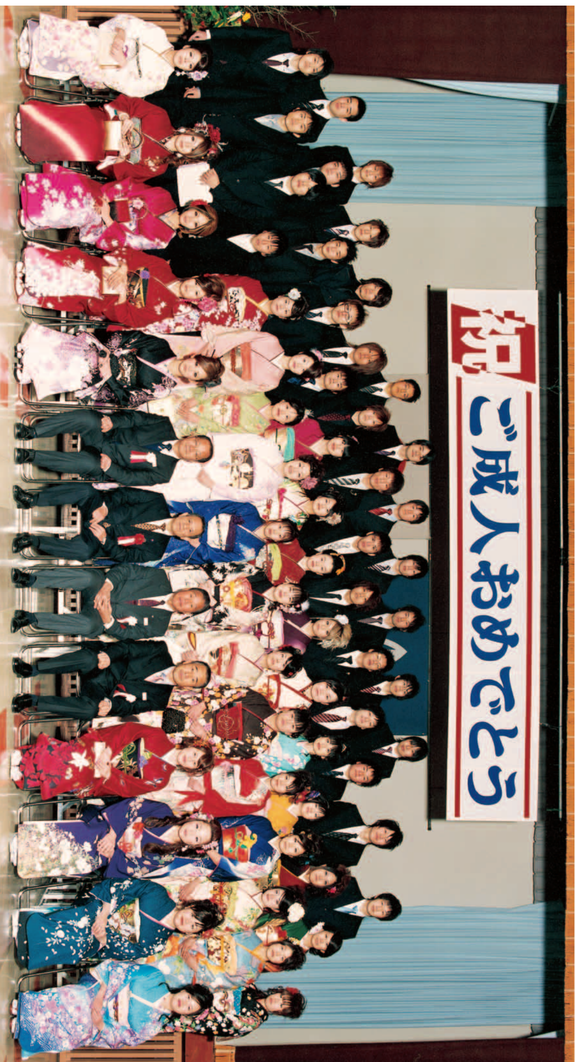
越知町新成人の集い 平成20年1月3日