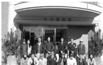
地域安全協会と合同で署前に門松の作成