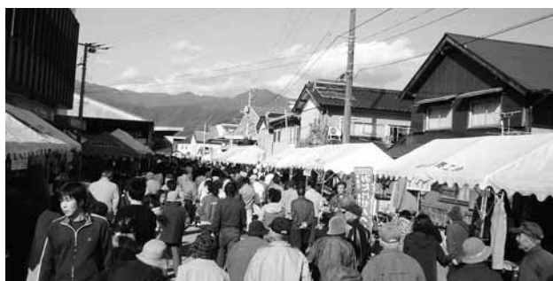
大勢の人々で賑わいました