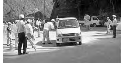
ドライバーサービス(仁淀川町)