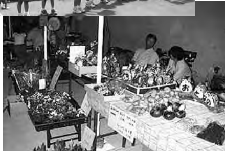
地場産品などが販売されました