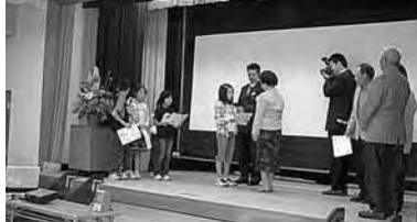
高齢者交通・防犯教室