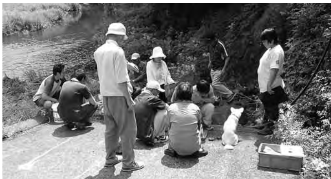
坂折川の水質調査

水質調査とフクリンサユリの保護地の観察をとおして、越知町の自然のすばらしさを実感すると共にこの美しい自然をいつまでも残したいと思えました。