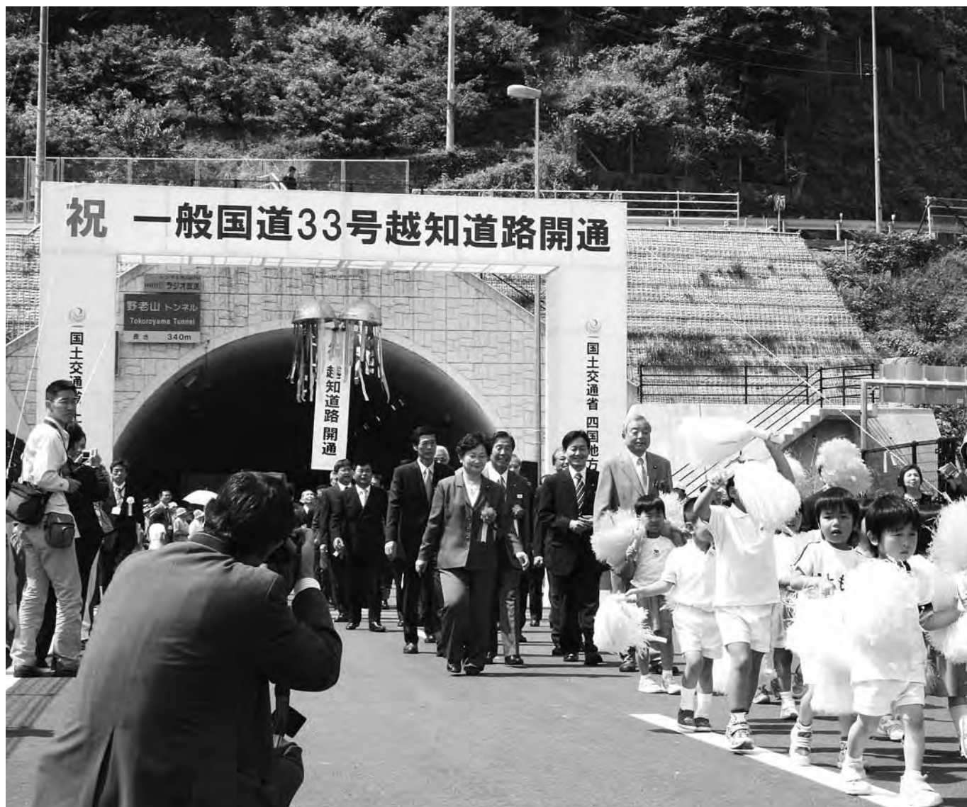
一般国道33号越知道路開通記念式典