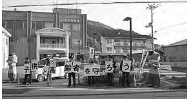
佐川署前にて交通安全広報

安全運動期間中、ボランティアの方をはじめ多くの地元の皆様にご協力頂き、ありがとうございました。