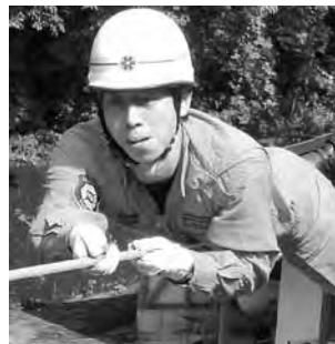
ロープブリッジ渡過