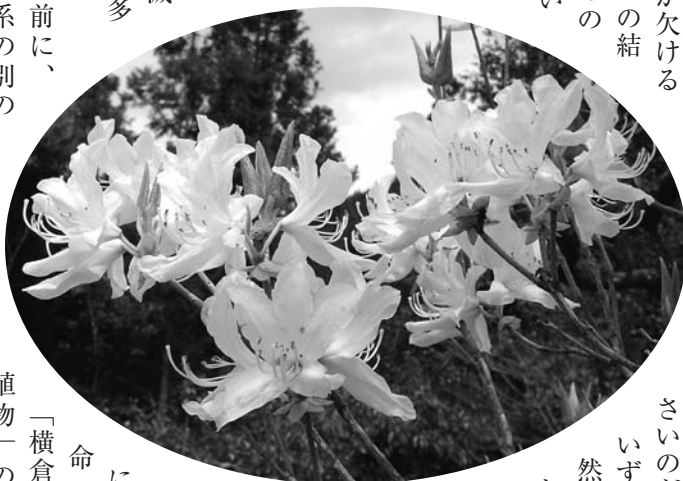
「横倉山タイプ植物」の一つで、一般に花は赤紫色です。一方、白花のツツジの中に、シロヤシオというのがありますが、これは葉が5枚なのでオンツツジとは全く異なりま

で、ときに紅紫色（ムラサキオンツツジ）のものがありますが、白色のものは極めて珍しいようです。ある種の元素が欠乏し、クロロフィル（葉緑体）が欠ける「白化現象」の結 果生じたもので、動物でいう「白子」（アルビノー）に相当します。この種のものは、繁殖力が弱いため、増殖できずにすぐ消滅することが多 いうようです。30年以上前に、同じ横倉山系の別の岩場（カプト嶽東方の4億年前の花崗岩地域）に2株自生していた白花のトサノミツバツツジの内の1本を、高知市五台山の牧野植物園