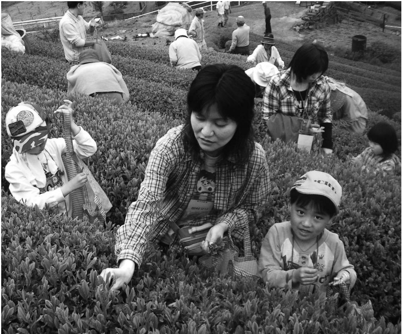
「虹色のさと横畠」茶摘み体験ツアー