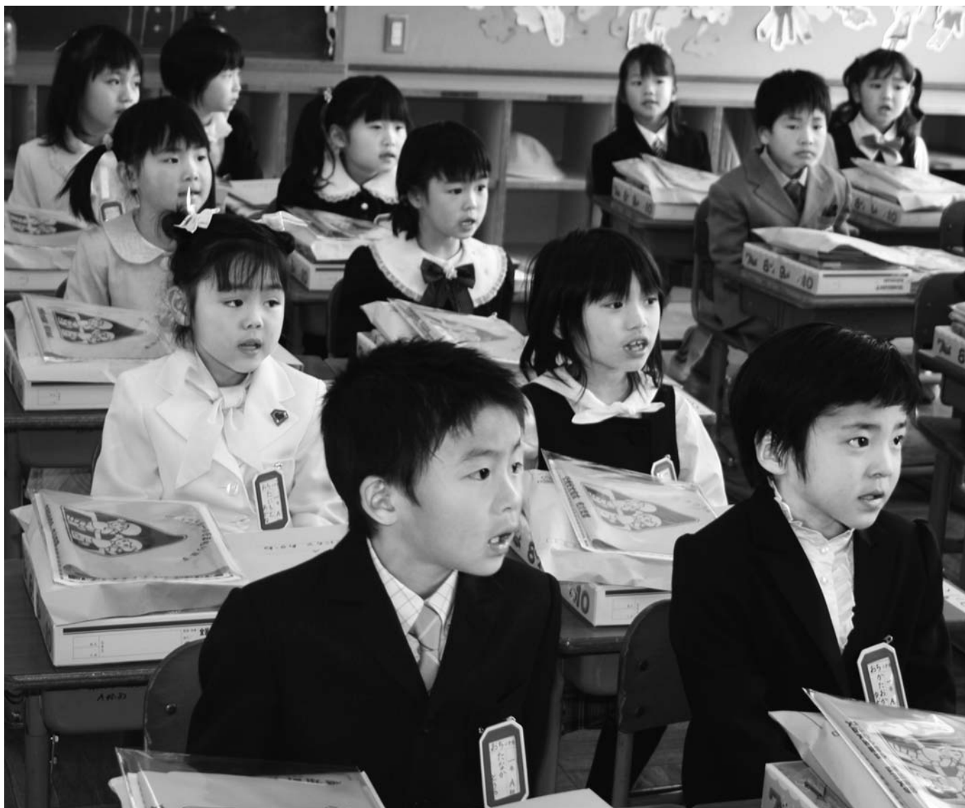
越知小学校入学式