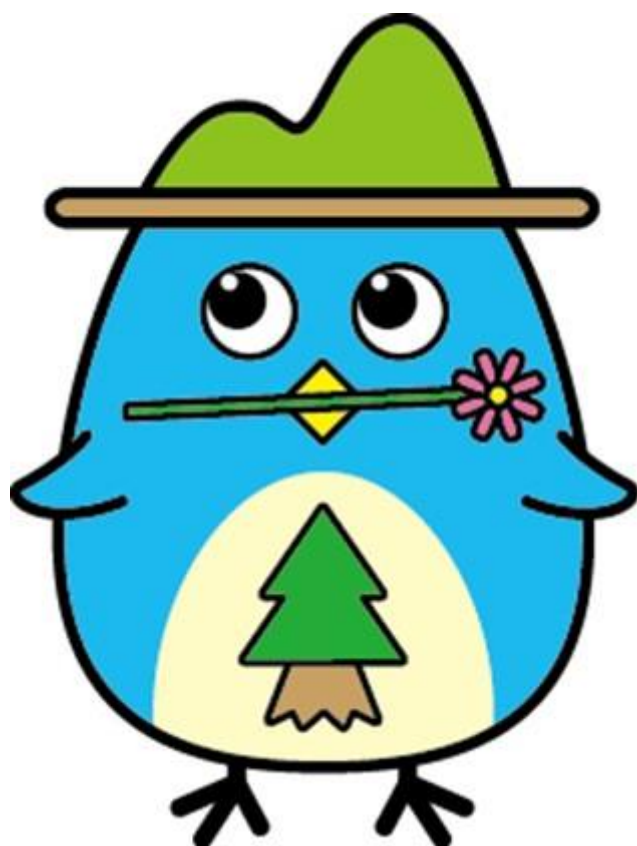
越知町イメージキャラクター『よコジロー』