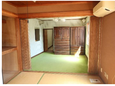
2F・和室③から見た洋室②