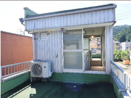
3F・ペントハウス北側