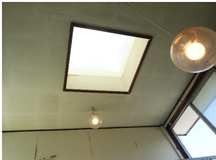
3F・ペントハウス天井