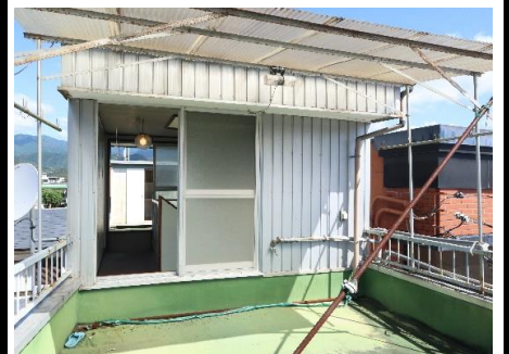
3F・ペントハウス南側