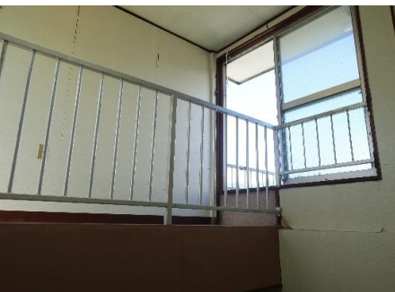
3F・ペントハウス渡廊下