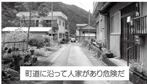
町道に沿って人家があり危険だ