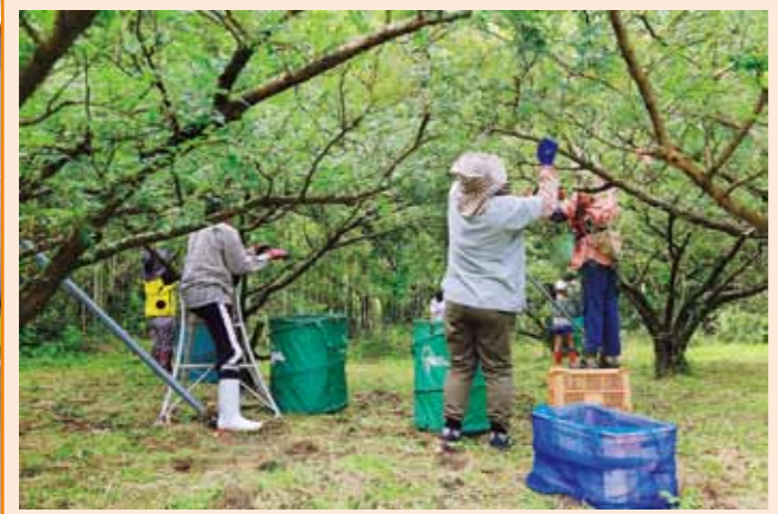
本町の夏の風物詩となっているサンショ乾燥実の収穫作業。得意先に薬用・食用として、それぞれ出荷される。