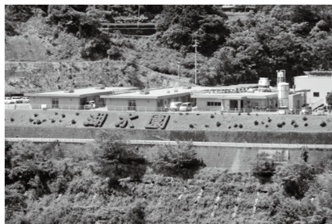
障害者入所施設「湖水園」は開所から33年

問 湖水園を完全バリアフリー化と個室に改築することはできないか。 また、あらゆる障害に対応できるスペシャリストの育成も必要だと思つが、考えは。