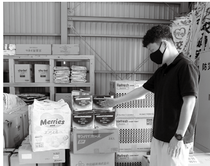
備蓄されている生理用品とおむつ(備蓄倉庫)

問 コロナ禍による経済的な理由で若者の5人に1人が生理用品の入手に苦労しているという調査結果が出ている。これをうけ、無償配布などの取り組みが各地区で広がっているが、本町での考えは。