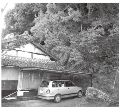
山間部は住環境整備も重要課題だ