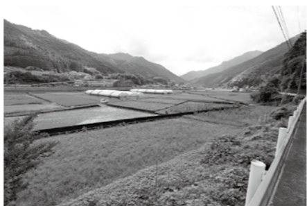
耕作放棄地が増える文徳

の施設を総合的に推進することが目的である。知事からの指定で、10年間を見通し、農用地区域を定めた農用地利用計画と農業振興の基本計画を作成する。区域として定められた土地は、基盤整備事業や融資など様々な支援を受けることができる。