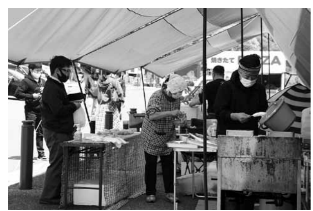
町内事業者が参加したテイクアウトマーケット