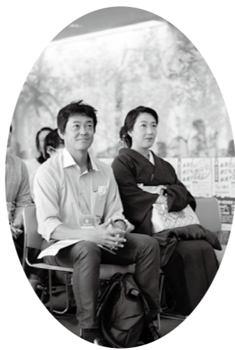
著名人も参加した越知ぜよ!熱中塾