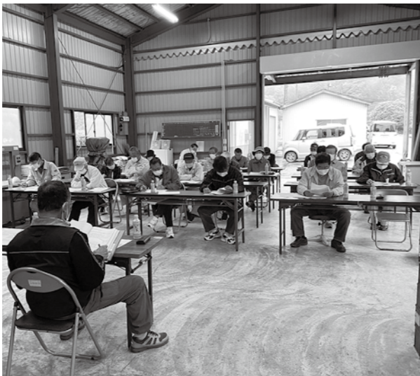
コロナ禍で青実の市場相場が気になる定期総会