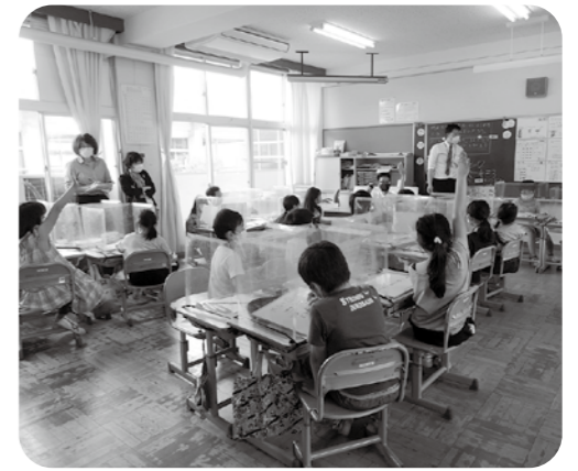
しっかりとした行政の手立てが必要だ