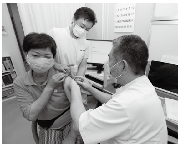
町内5つの病院でワクチン接種が可能