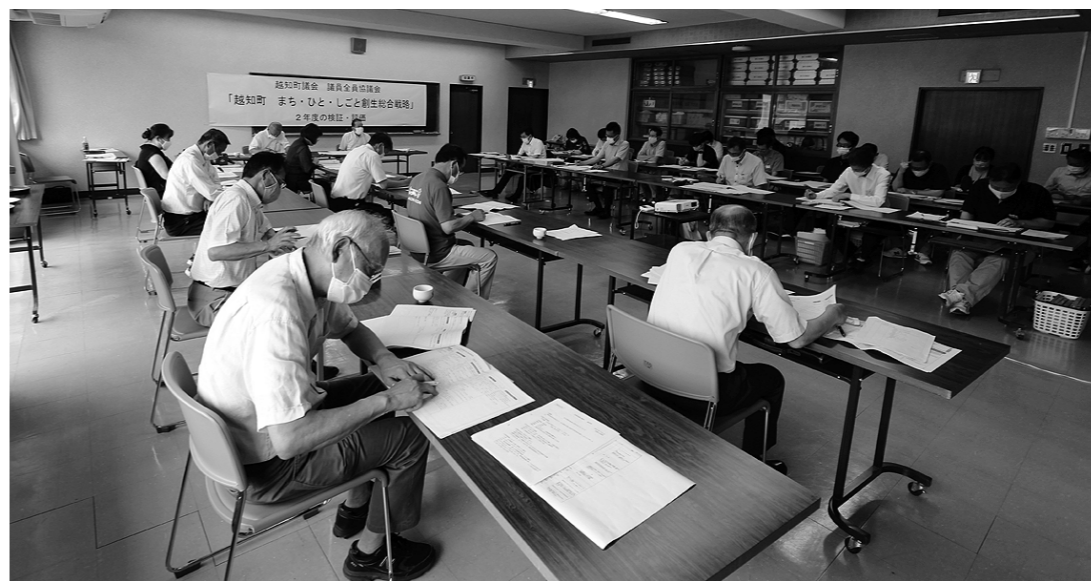
創生総合戦略の検証・評価を行った全員協議会

7月6日に、町幹部職員を交え全員協議会を開き、まち・ひと・しごと創生総合戦略「おち家の挑戦」の2年度の取り組み状況と3年度改訂案の検証・評価を行った。