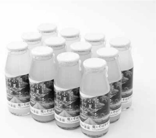
6次産業を学べる(株)岡林農園

【大原企画課長】 2年度の取り組みでは、町内事業者が多く参加した。かわの駅おちを作った時に、仁淀川流域の発展も事業のひとつに含まれており、町内は勿論であるが、町外の人にも積極的にアプローチしていく。