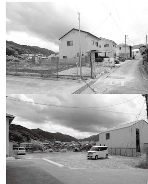
残る課題は集合住宅の建設