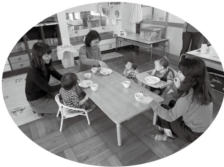
2年間休止となっている子育て支援センター