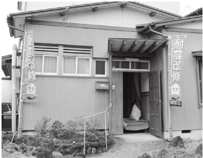
地震に備えて耐震改修を

本町議会は、行政事務のチェックだけでなく、独自の政策提言を行っている。今回検証を行ったが、計画通りに進んでいない事業もあるので、今後も継続して提言や検証を行い、地方創生事業の成果を上げていきたい。