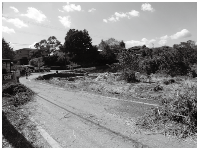
一団となった農地の塵芥を撤去する