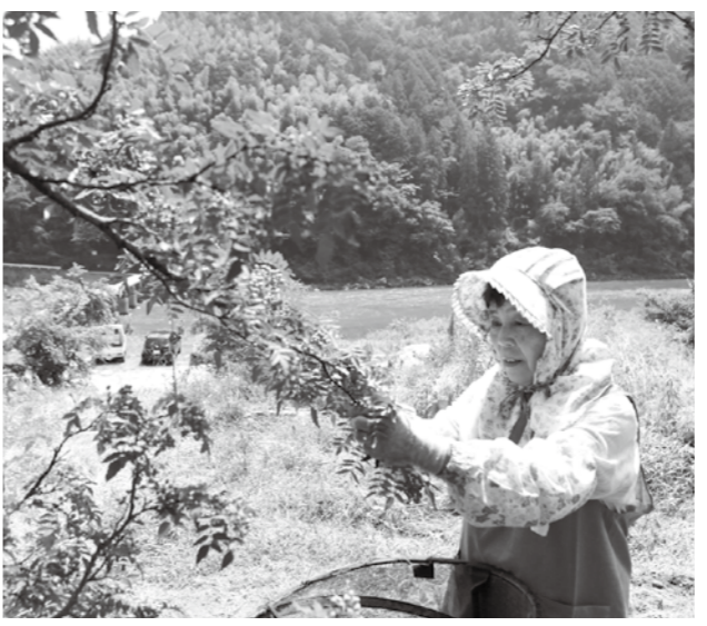
人手不足が心配されるサンショの収穫作業

問 薬用サンショの収穫や選別に必要な人手が不足し、廃業する農家が出てきた。最近選別作業用に開発された「くず葉取り機」は、人力の約3倍の能力があり、農家は導入を希望している。本町の振興作物であるサンショの安定生産や人手不足の解消策に、補助制度をつくる考えは。