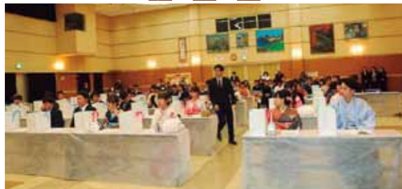
1月3日に町民会館で“新成人の集い”が開かれ、新成人となられた40人の新たな門出を祝いました。