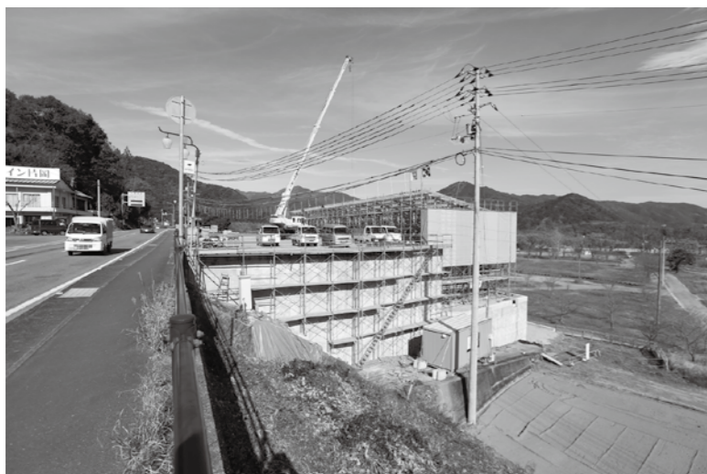
急ピッチで工事が行われている宮の前センターハウス

小田町長 コスモまつりの時は、お客さんからの苦情がある。今回新しい施設ができるので、これまで以上に協議を重ねる。