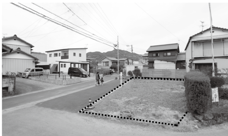
越知のまち小屋設置予定の場所(点線で囲った部分)