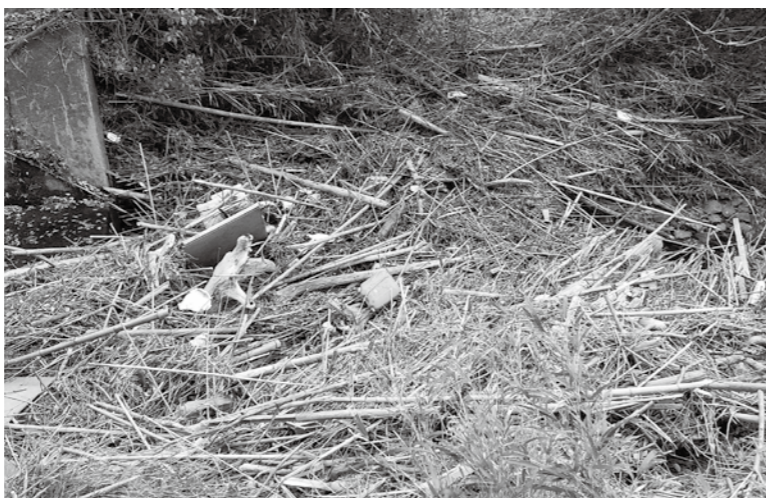
仁淀ブルーが台無しですよ

問 梅ノ木川の出口には台風や集中豪雨により流れてきたポリタンク、発泡スチロール等のごみがある。