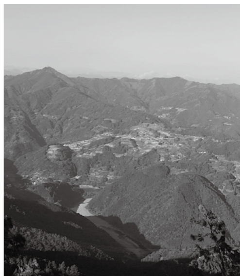
本町の総面積の約85%は山林だ

提出者 武智龍議員 国産材、特に地域材の需要拡大、公共建築物の木造化推進のための支援