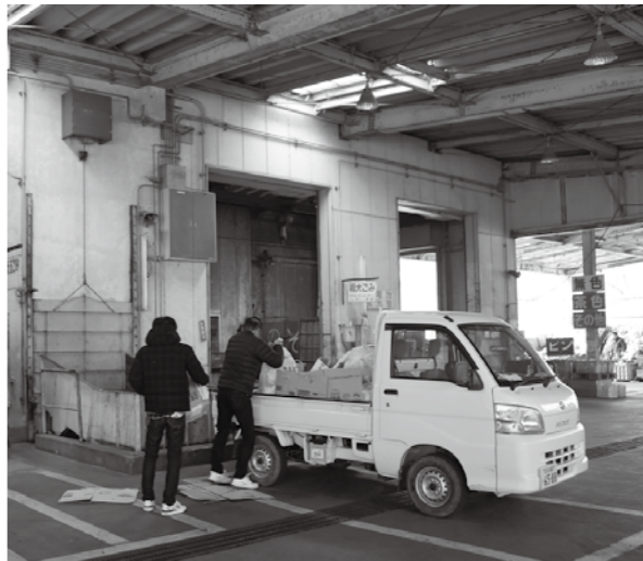
清掃センターに持ち込まれるごみは、1日平均37t うち越知町から持ち込まれるごみは8.7t

問 現在、無料券は1年に1回使えるが、申請した日から1週間以内に使わないと無効になる。この使用期限を1カ月もしくは1年以内にしてほしいとの声があるが。