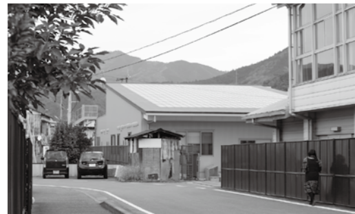
給食調理場の太陽光発電施設

FIT法により、省エネの固定価格買取制度の運用で太陽光や風力発電の事業者は無保証で出力制限に應じなければならぬというルールになっている。今回この要請があり、出力制御装置を取り付けるものである。