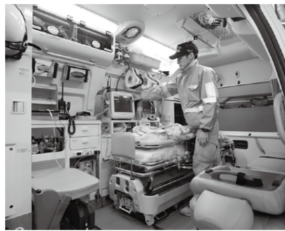
仁淀川分署に配備された救急車には、最新型の高度救命処置用資機材が搭載されている

救急車を更新 高規格救急車を更新し、9月14日より運用開始している。走行安定性、機動性に優れ、車内には走行中の振動を吸収し患者の負担を軽減する防振機能付きのベッドなど最新型の高