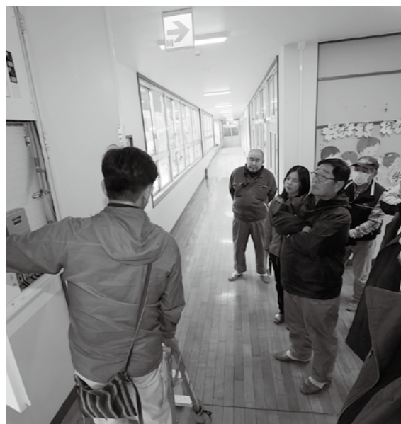
本体工事が完了し、設備の操作説明を受ける地区代表者