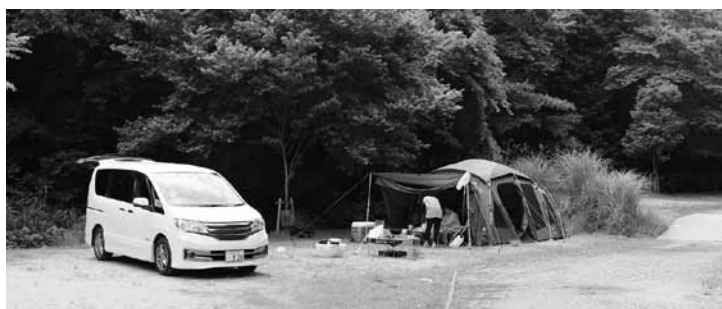
利用者は奈良県から来ていた