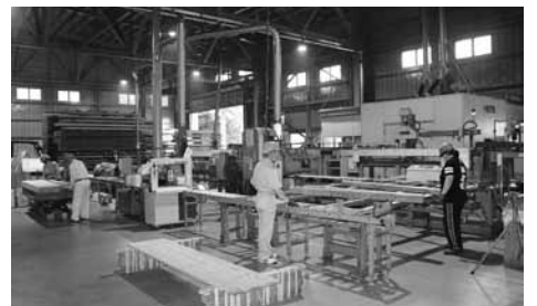
最新鋭の技術で製造販売を行う