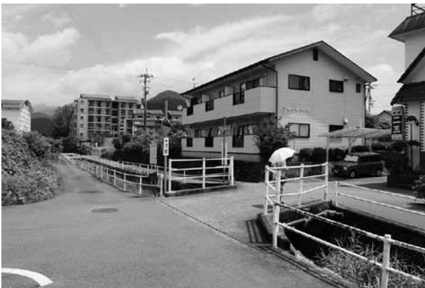
改良が検討されている梅ノ木3号橋付近