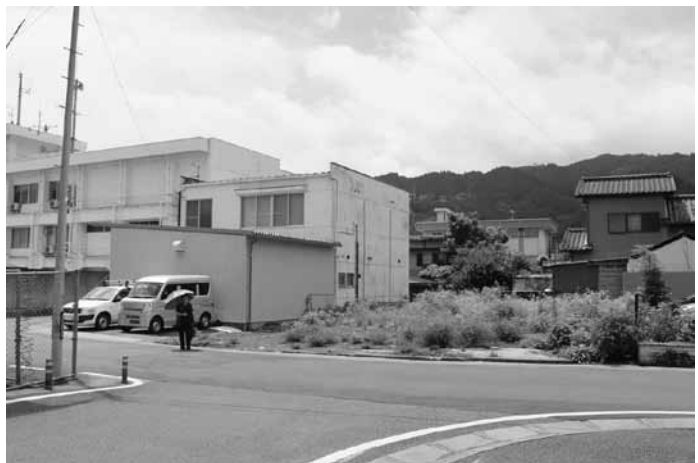
測量される空き地