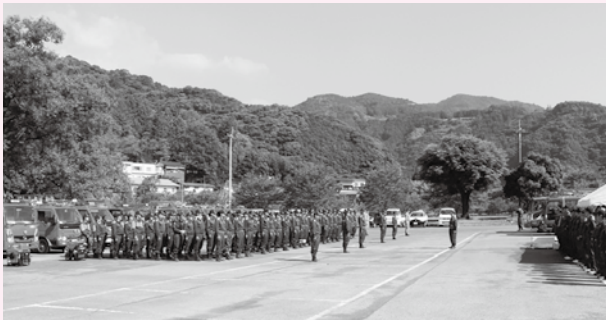
6月26日に、消防団水防演習が行われた。台風シーズンを迎え、団員は機械器具点検や分列行進、一斉放水などに真剣に取り組んでいた。