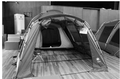
自然館ではスノーピークの全商品を扱う