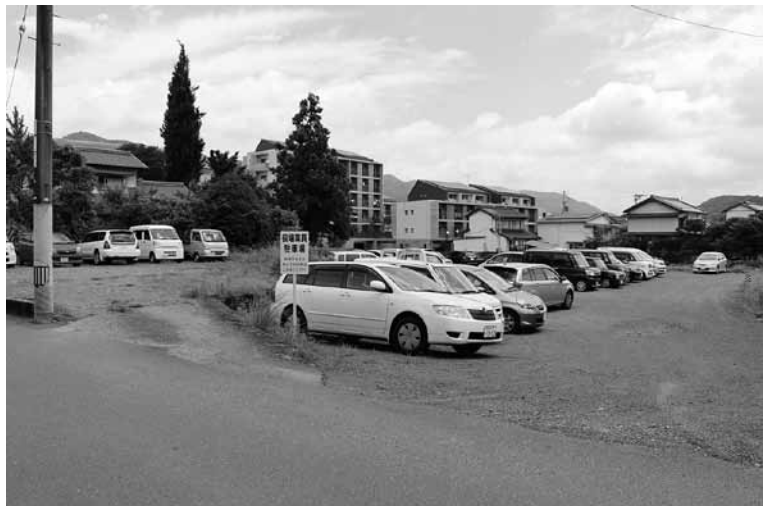
有料となった小学校東の職員駐車場