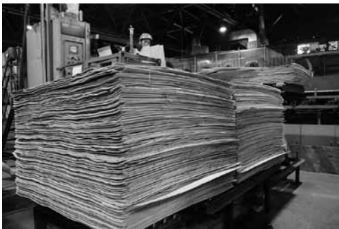
丸太を薄く削ぎ接着してLVL材に加工