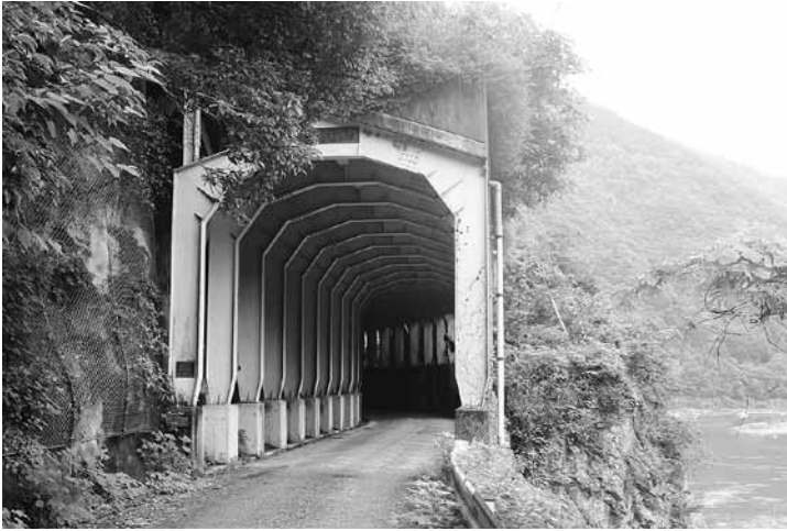
放水口の約300m鎌井田寄りにあるロックシェッド(洞門)