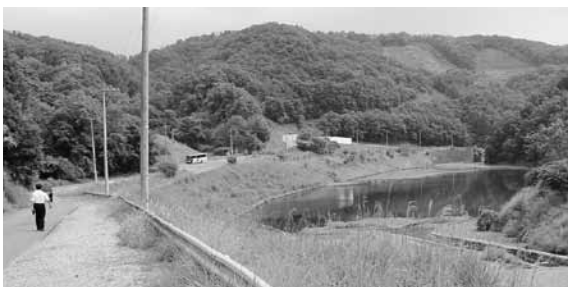
キャンプサイトは水辺周辺にある