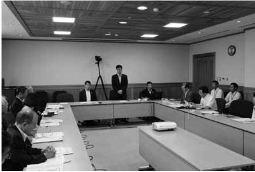
増原町長の熱い思いを感じた

㈱オロチには、1立方メートル当たりの仕入れが、8000円なら赤字になるが、超えると赤字になるので、1000円の補助を出している。 町内森林資源の活用が図られ、雇用創出に大いに貢献しているが、山元には、1・5ヘクタールで18万円くらいの収入となっている。