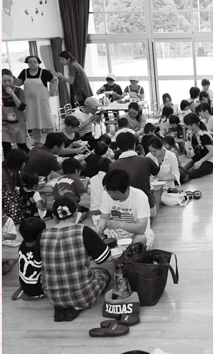
写真は幼稚園のカレーパーティー(6/24)