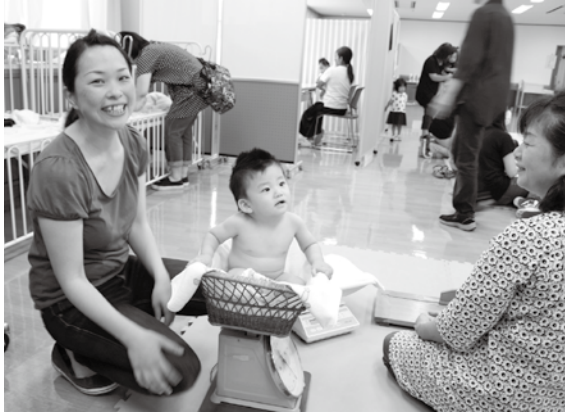
保健福祉センターで行われている乳児健診(7月6日)

問 発達障害者のそれぞれの特性に応じた支援を強化する改正発達障害者支援法が5月に成立した。これを受け、本町での支援の取り組みと啓発の方法は。