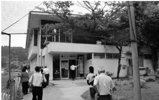
体育館を事務所に利用

自然館は、キャンプ場のテント張りの指導のほか、ヨガやダンスグループへの部屋の貸し出し、週1回少年サッカーや年1回の盆踊りに使う。