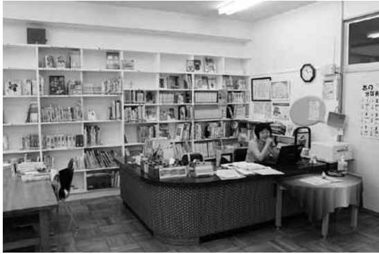
学校図書充実にも使われる(小学校)