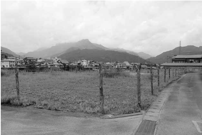
議論が伯仲した購入予定地、移住定住用地として期待される