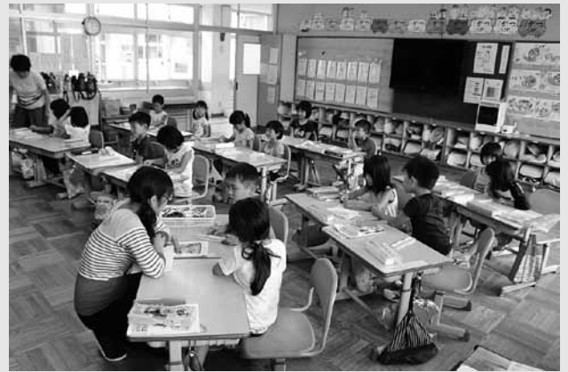
小学校1・2年生は30人学級となり、個に応じたきめ細かな指導ができている