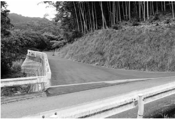
延伸を待ち望む農道丸山2号線