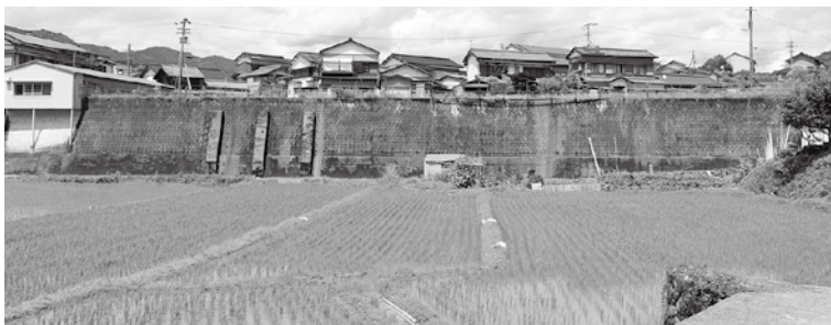
南側はのどかな田園風景だ

中内企画課長 分譲希望者には、指摘されたような状況なので土地の南側を庭にして北側に家を建てることを条件としたい。売買契約書には、地盤、擁壁などの専門的な調査をしていないことをうたいたい込む考えである。